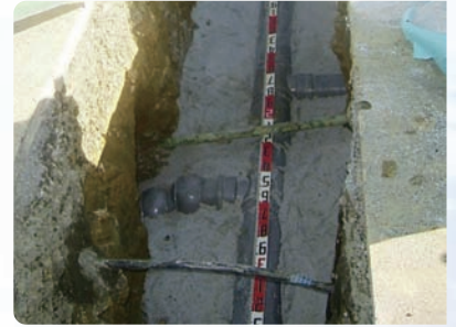
下水道管布設工事