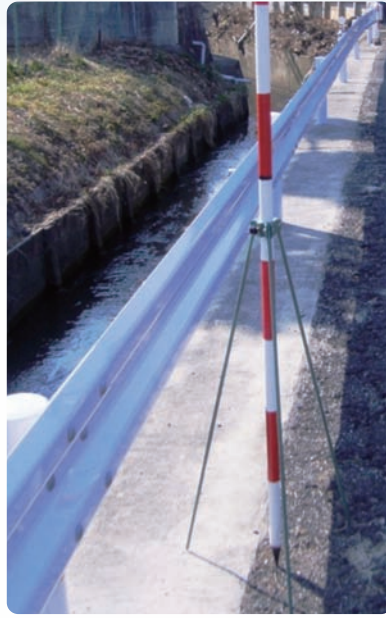
ガードレール設置工事