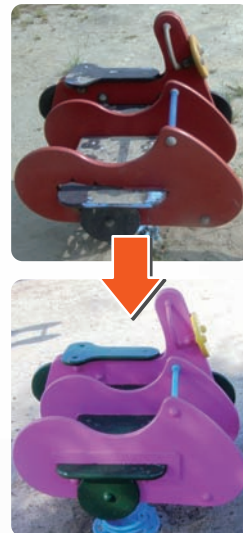
公園工事(遊具補修)