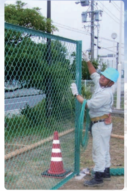
フェンス設置工事