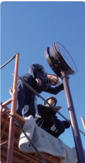
公園工事(時計設置)