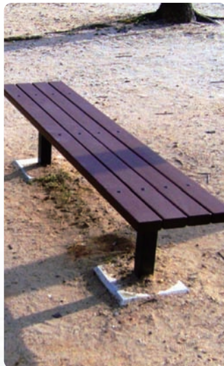
公園工事(ベンチ設置)